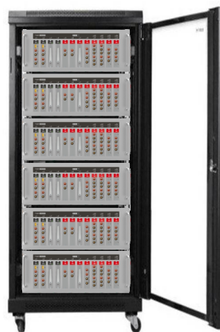
自由组合的抽屉式通道